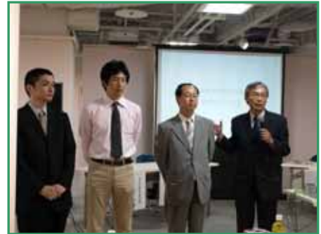
<（株）日本設計の担当者紹介>

本年度でその有効期間が切れることから、協定書第9条の規定に基づき、2年間の延長をはかるものです。設計協力の範囲など他の協定内容に変更はありません。